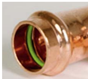
Tiettyjä puristusliittimiä voidaan käyttää jopa +180\text{ °C} :een lämpötilassa

Aurinkolämpöpiirin putket teknisen tilan ja aurinkolämpökerräjäiden välille asennetaan kupariputkista käyttäen liitoksiin kovajuottoa tai korkeisiin lämpötiloihin soveltuvin puristettavia putkiliittimiä.